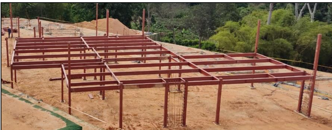
Ilustración 4. Estructura metálica instalada