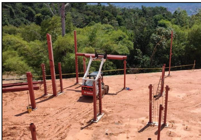
Ilustración 2. Sistema de izaje mecánico