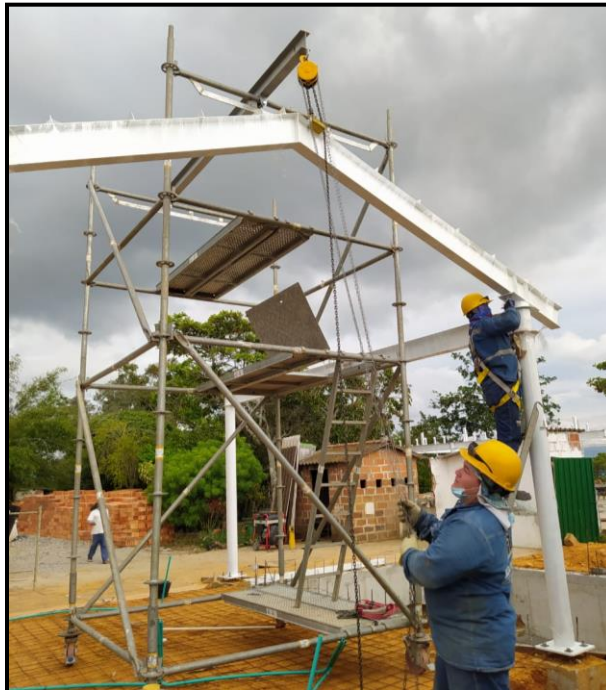
Ilustración 1. Sistema de izaje manual